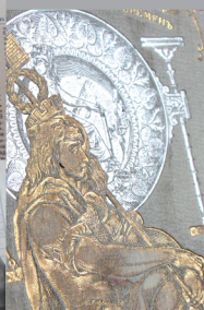
Первый в Омске Музей Книги