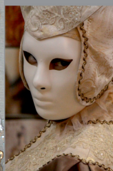
«...Три ночи». Как это было

ИСТОРИЯ ПЕРСОНАЛИИ ЛЕГЕНДЫ ЛИТЕРАТУРНОГО ЖАНРА ПРОСПЕКТ КУЛЬТУРЫ КНИЖНАЯ ПОЛКА ПРОЕКТ PLUS БИБЛИОПРОФЕССИОНАЛЫ В (ЭПИ)ЦЕНТРЕ КРАЕВЕДЕНИЯ