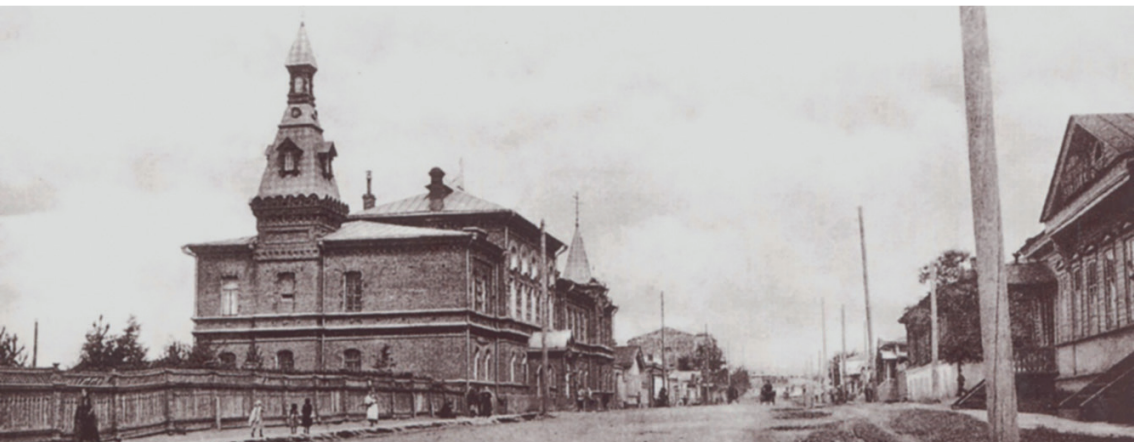
Здание Омской Городской Думы. 1907 г.