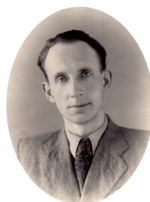
Знаковая фигура Омского библиотечного дела