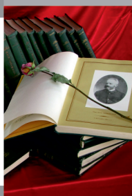
Отделу искусств «Пушкинки»