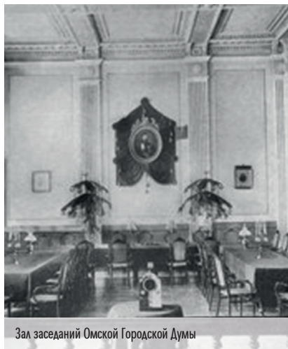
Зал заседаний Омской Городской Думы

4. В отсутствии подлинника текст Устава приводится по машинописным копиям, выполненным, вероятно, в более позднее время, и содержащимся в Государственном историческом архиве Омской области, Ф. 318. Оп. 1. Д. 1273, лл. 3-4, 9-10.