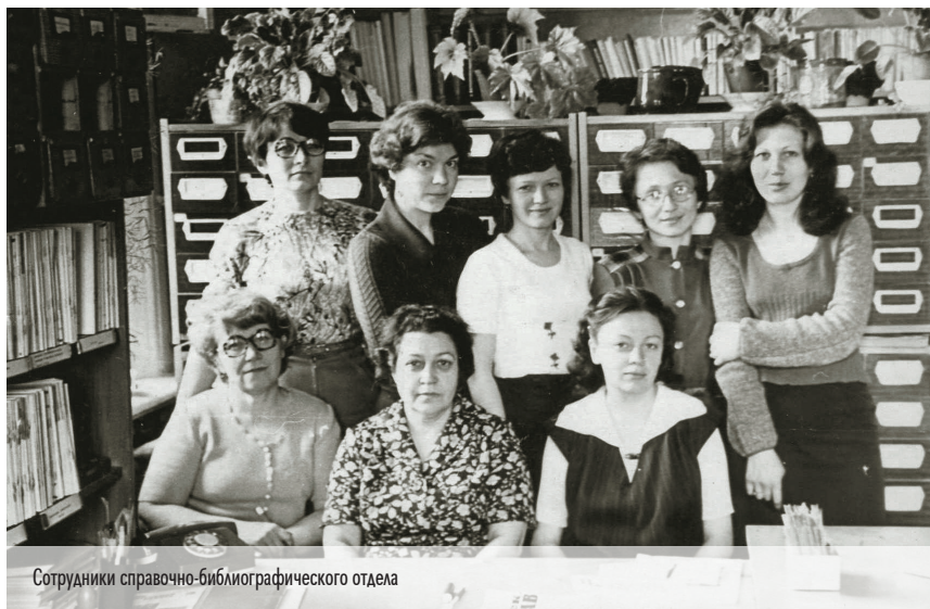
Сотрудники справочно-библиографического отдела