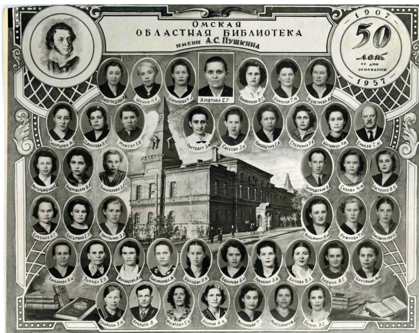
Сотрудники Омской областной библиотеки имени А. С. Пушкина. 1957 г.

личные, индивидуальные запросы читателей. В 1950-е гг. многие справки стали отражением тех вопросов, над которыми работали коллективы предприятий, учреждений области. Омичей интересовала литература по вопросам, связанным с освоением передовых технологий, выпуском новой продукции, усовершенствованием техники и производства: кирпичеделательные машины, опыт поточно-скоростного строительства, зубчатые передачи и редукторы, пеногазобетон, химико-нефтяная промышленность.