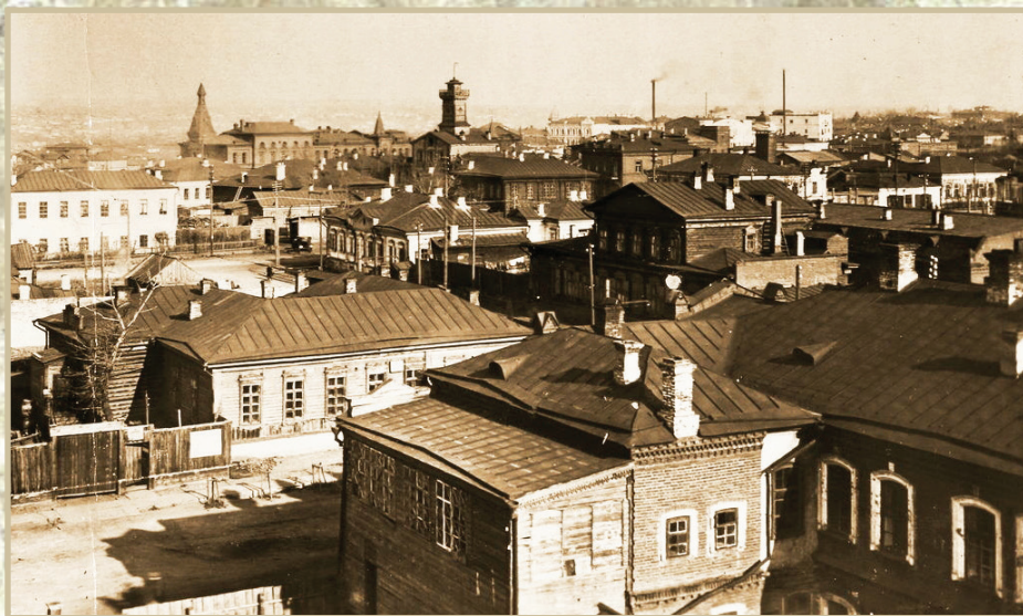
Панорама города. Вдали слева - здание библиотеки им. А. С. Пушкина. Фото 1936 года