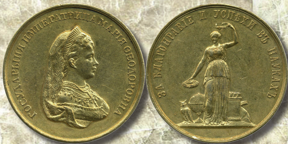
Золотая медаль для учениц женских гимназий Министерства народного просвещения «За благоумие и успехи в науках»