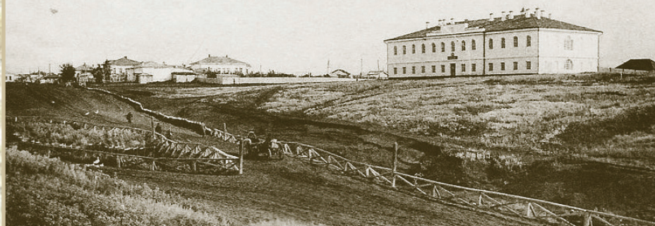
Петропавловскъ.—Petrovavlotsk. № 9. Театръ. Военный лазаретъ.