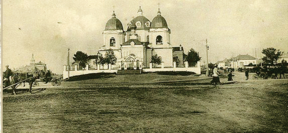
Церковь Святого Ильи Пророка