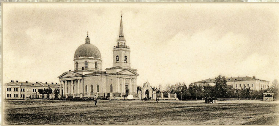
Казачья площадь. Справа - здание Войскового хозяйственного правления