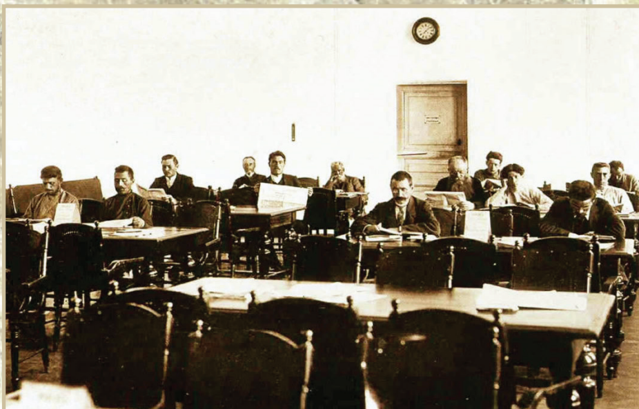
Читальный зал библиотеки имени А. С. Пушкина. 1910 г.