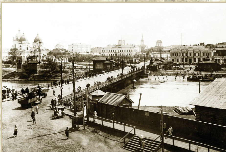
Панорама Омска . 1920-1930гг.