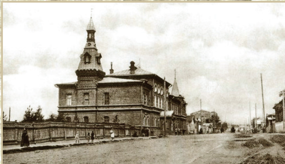
Здание Омской Городской Управы, в котором в 1907 году была открыта Городская библиотека имени А. С. Пушкина