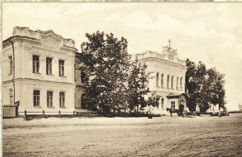
Здание Омской 1-й женской гимназии почётных граждан Поповых