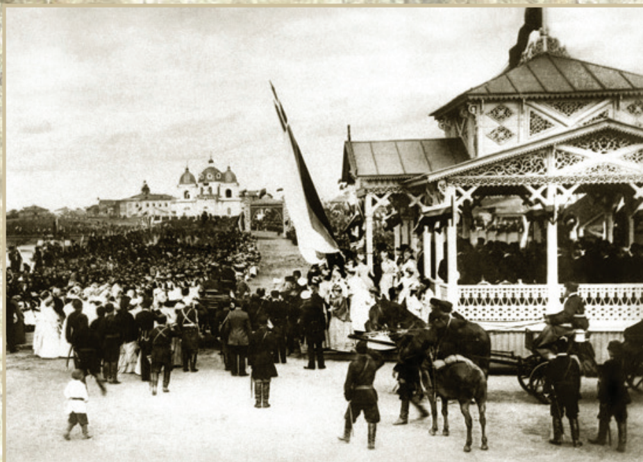
Встреча цесаревича Николая в Омске. 1891 г.