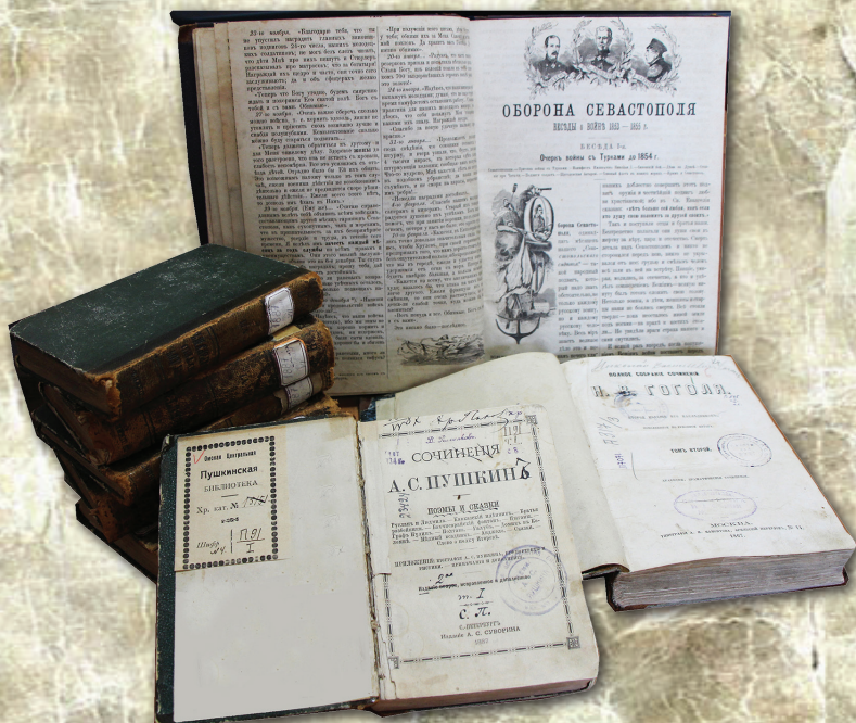
Книги личной библиотеки семьи Пахолоковых. Из фондов ОГОНБ имени А. С. Пушкина