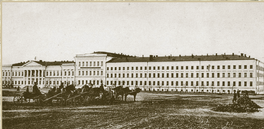
Здание Сибирской военной гимназии (с 1907 г. - Омский кадетский корпус)