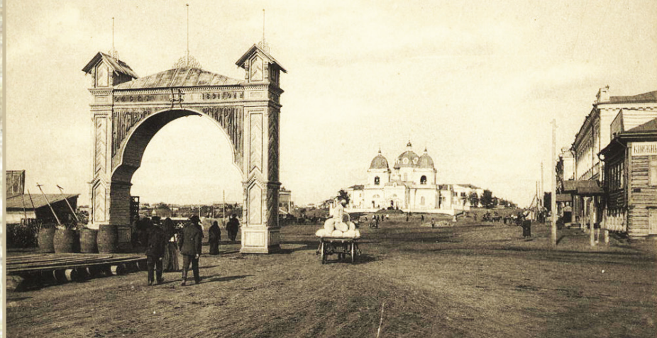
Омск. Царские ворота