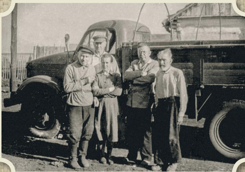
У экспедиционной машины Географического общества в с. Большемогильном. Июль 1962 г.